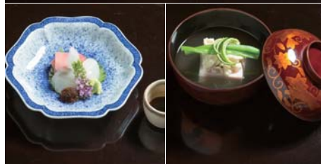
出張御料理の一例 松花堂弁当と椀盛