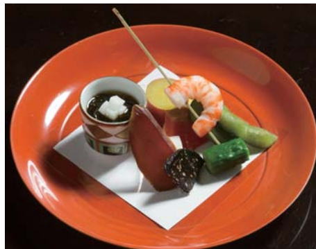
四季会席の一例 八寸(上)・御造(左下)・椀盛(右下)