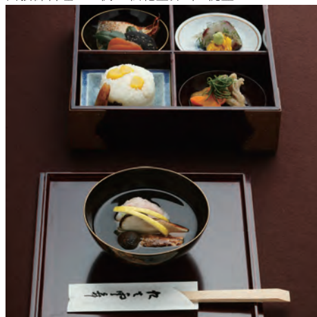
四季会席の一例 八寸(上)・御造(左下)・椀盛(右下)